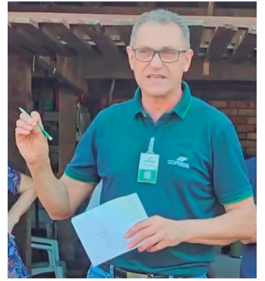
Por FLÁVIO DURANTE Gerente do Fomento de Leite da Copérdia