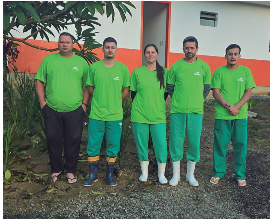
Equipe de colaboradores da granja da Família Wiggers