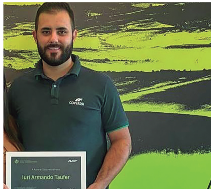
Premiação reconheceu empresários rurais e técnicos

A 11ª edição do Prêmio Empreendedor Rural Cooperativista, promovido pela Aurora Coop, reconhece a excelência do trabalho produtores e técnicos. A premiação homenageou técnicos agropecuários e empresários rurais cooperados ao Sistema Aurora Coop que alcançaram resultados superiores em eficiência, gestão e desempenho zootécnico nas cadeias de aves, suínos e sustentabilidade. O evento, realizado anualmente, premiou nesta edição 31 profissionais e traduziu, em cada catego-