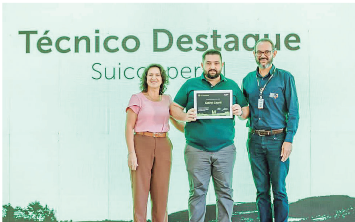
Profissional aposta no trabalho em equipe para potencializar resultados.

Cavalli enaltece o sentimento de orgulho e, também, motivação trazidos pela recente conquista. “Estar entre os melhores por três anos seguidos mostra consistência no trabalho, mas ao mesmo tempo nos impulsiona a buscar evolução contínua e resultados ainda melhores”, finaliza.