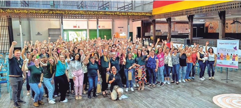
Peritiba - SC, dia 23 de outubro