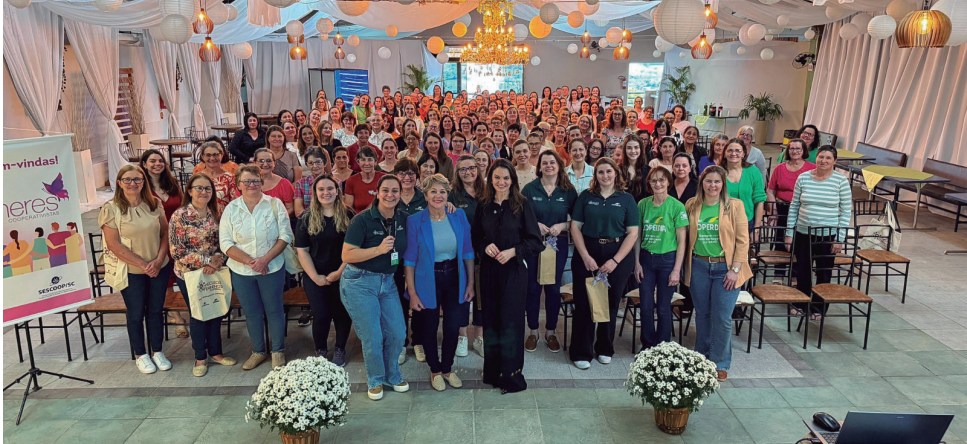
Itá - SC, dia 25 de setembro