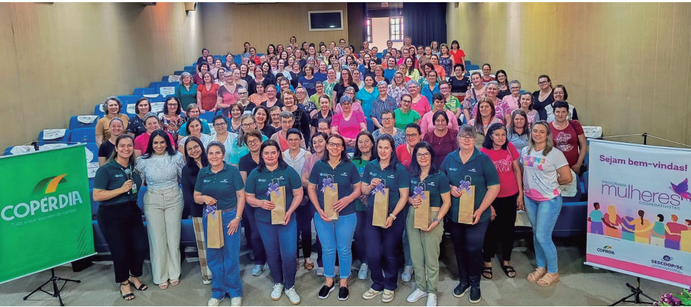
Piratuba - SC, dia 10 de novembro