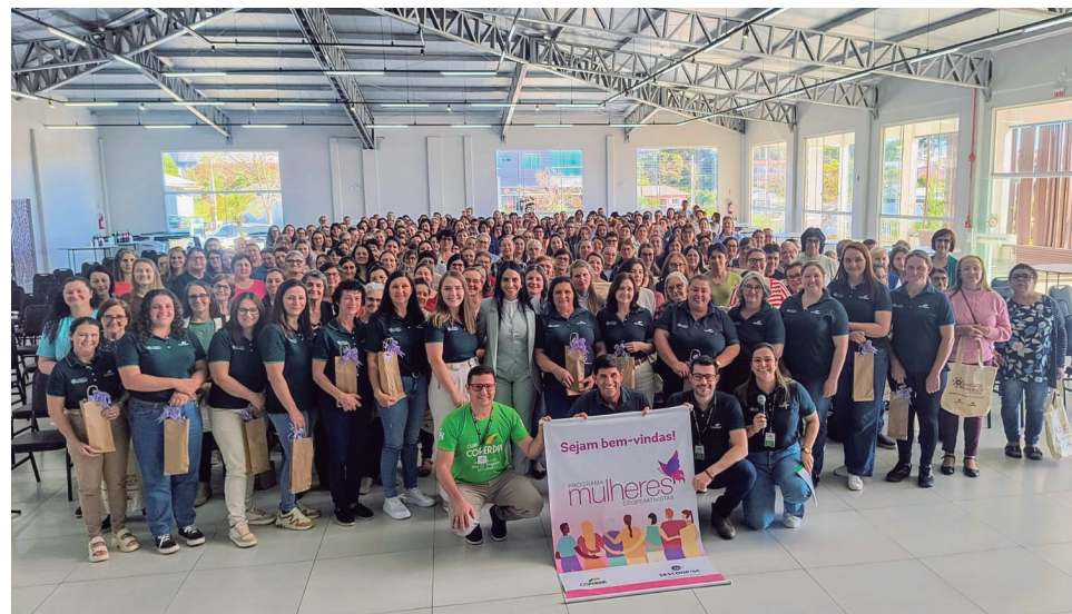
Iraní - SC, dia 21 de outubro