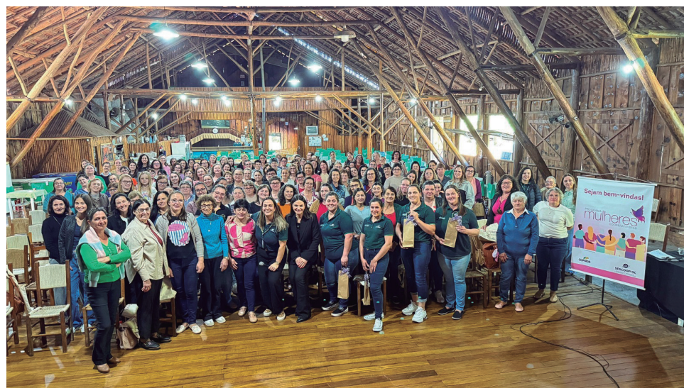
Capinzal - SC, dia 23 de setembro