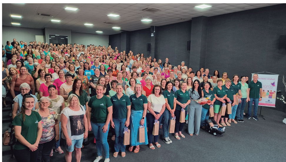
Arabutã - SC, dia 25 de novembro

Obrigada a todas as mulheres que caminharam conosco em 2025. Que 2026 venha com ainda mais conhecimento, conexão e inspiração!