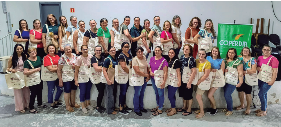
Salgado Filho - PR, dia 07 de novembro