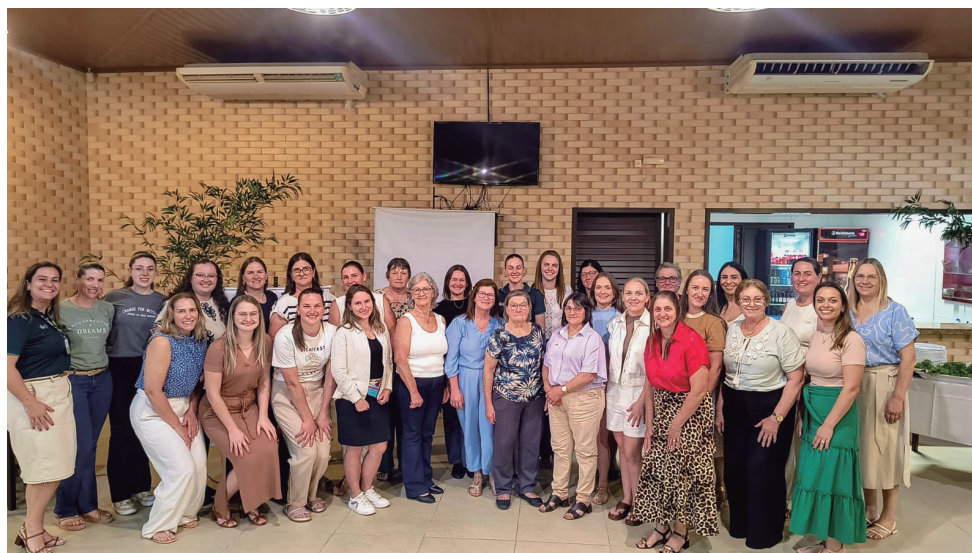
Braço do Norte - SC, dia 21 de novembro