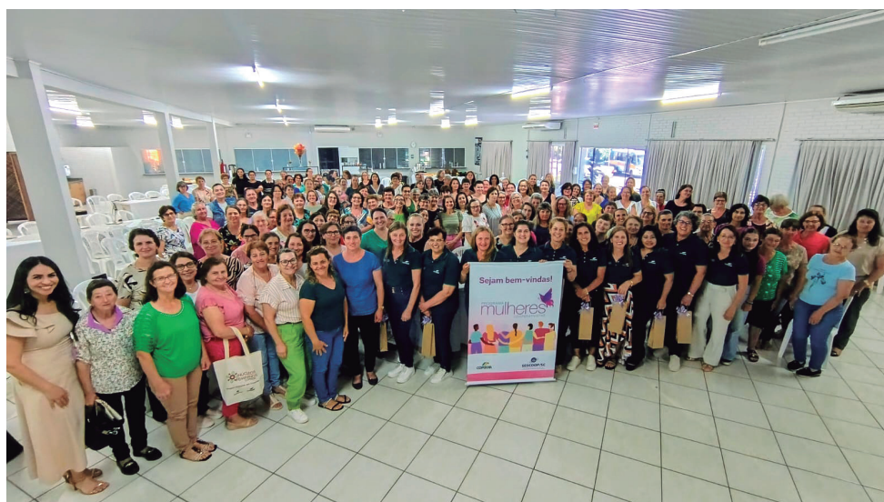
Concórdia - SC, dia 24 de novembro