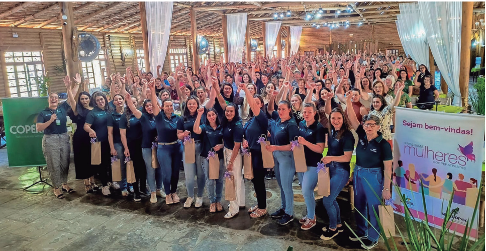
Presidente Castello Branco - SC, dia 11 de novembro