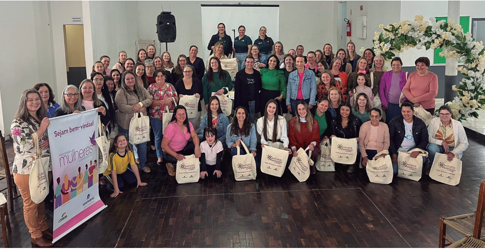
Irineópolis - SC, dia 20 outubro