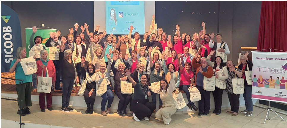
São José do Cerrito - SC, dia 24 de setembro