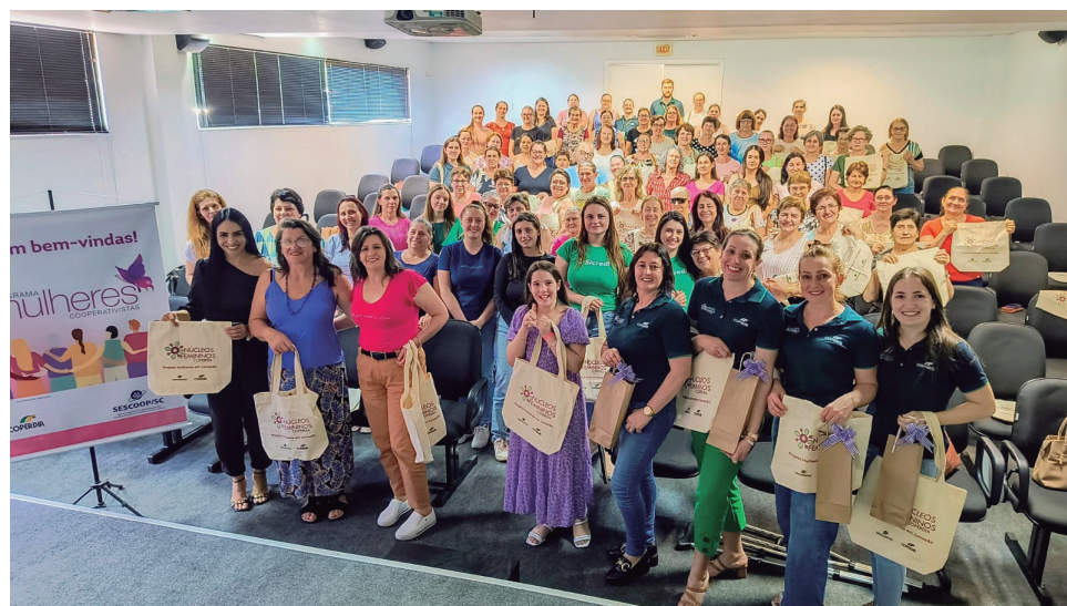
Arvoredo - SC, dia 24 de outubro