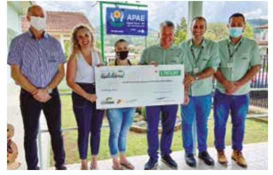
Entrega na Apae de Água Doce