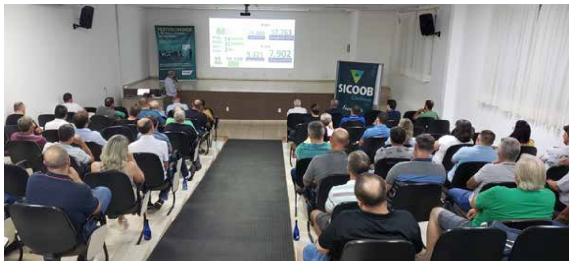
Encontro com Delegados de Concórdia e Presidente Castello Branco, realizada no dia 25/11 em Concórdia/SC.

Os encontros foram realizados em quatro cidades da região da AMAUC - Associação dos municípios do Alto Uruguai Catarinense, Seara