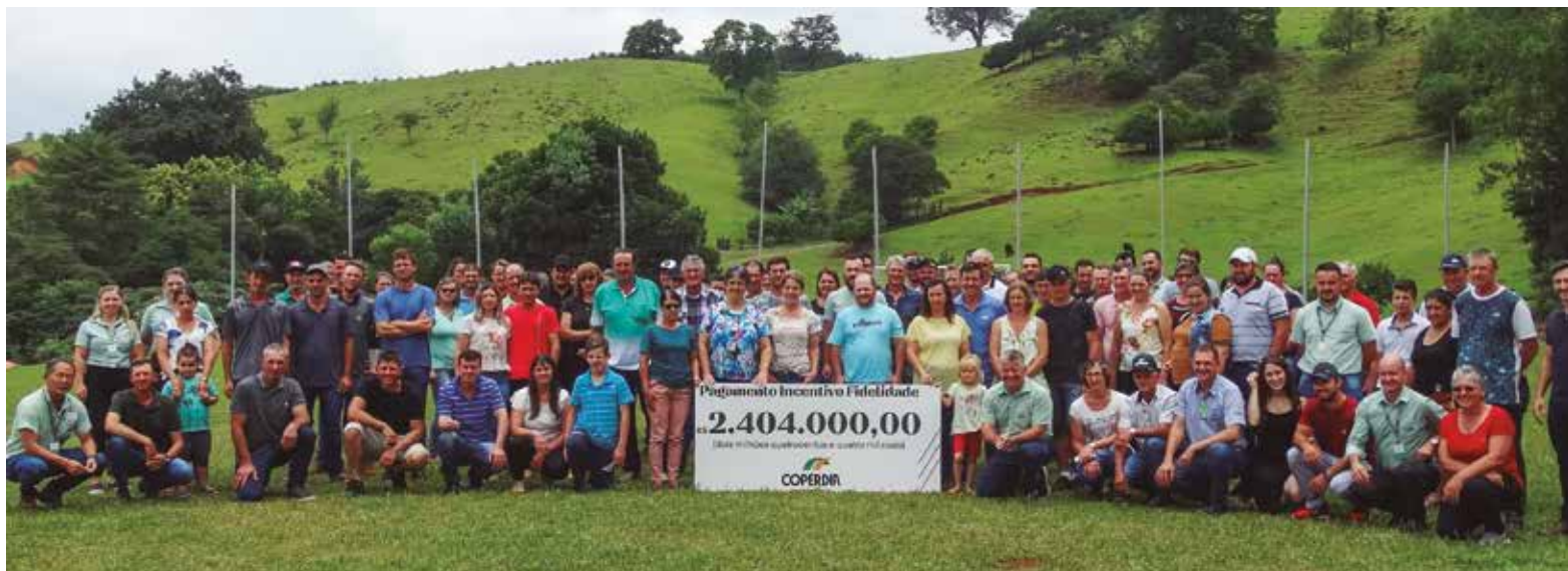
OS LÍDERES do negócio leite receberam o cheque simbólico com valor do Incentivo Fidelidade

O fomento de leite deu posse a 44 líderes eleitos e reeleitos para o negócio para os próximos quatro anos, no dia 14 de dezembro, na ACERCC, em Santo Antônio.