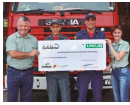
Corpo de Bombeiros de Itá