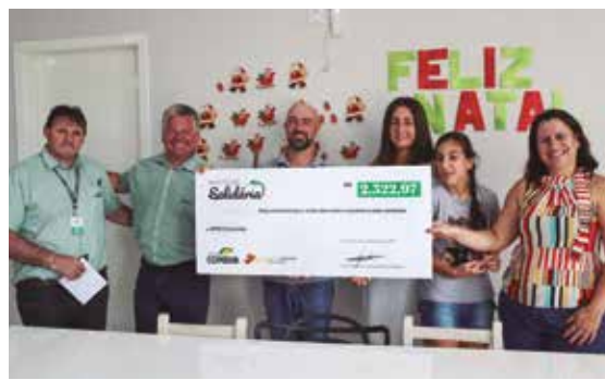
Entrega na Apae de Concórdia

um momento de solidez e sustentabilidade na cooperativa devemos muito às sociedades onde atuamos, e é nestas ações, envolvidos com nossos clientes que