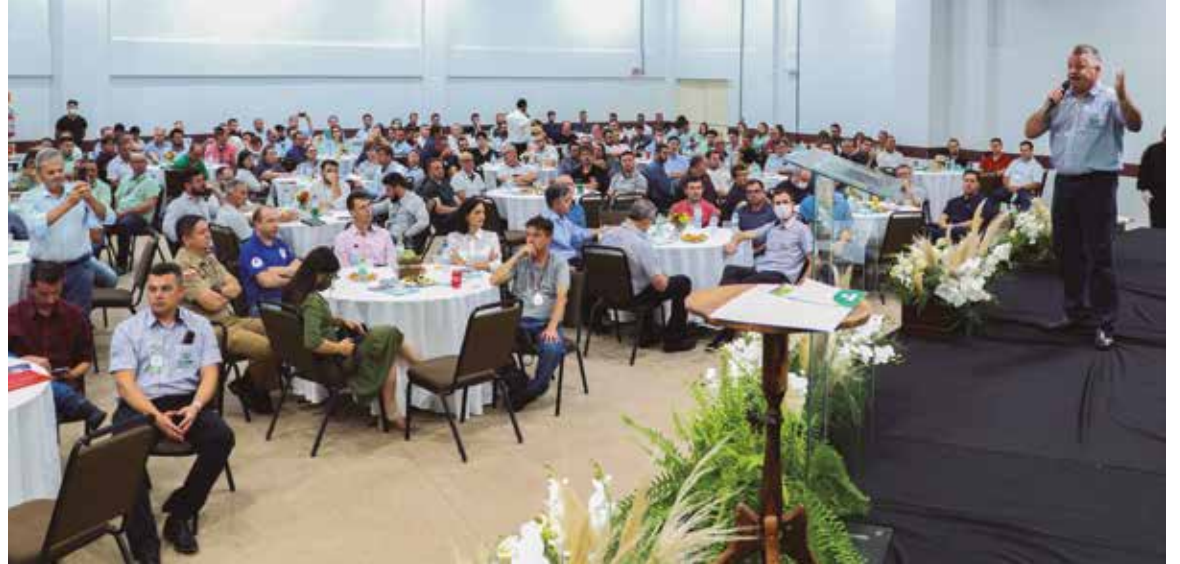
Lançamento do Tecnoeste 2022 reuniu organizadores, patrocinadores e expositores