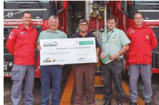
Corpo de Bombeiros de Concórdia

Para cada litro de gasolina comum ou aditivada abastecido durante esse período a cooperativa repassou 0,01 centavo às entidades, totalizando mais de R$ 10 mil reais entregues. Foram beneficiadas as APAE's